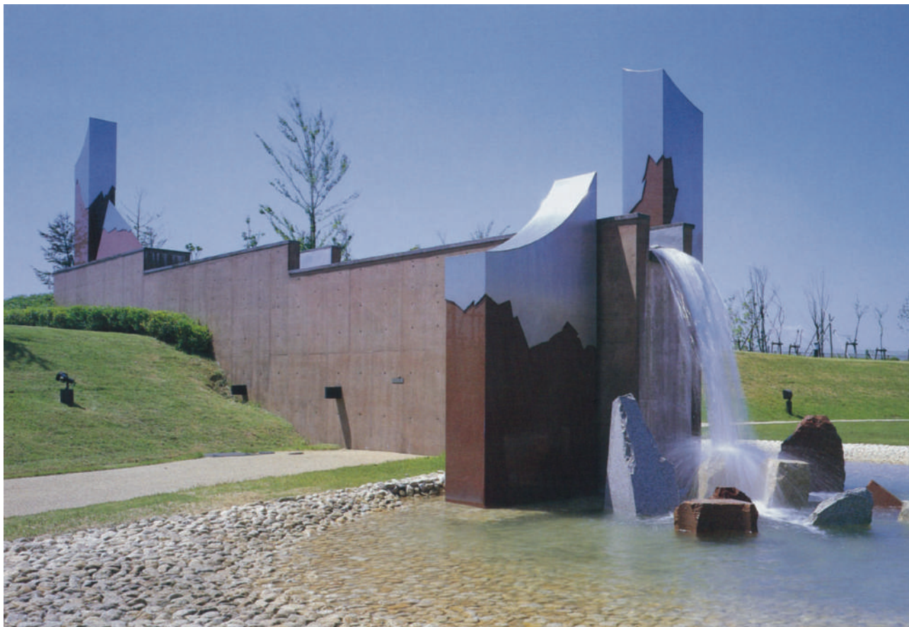
「水の息吹」小松暁一

その街や広場のシンボル、またランドマークとして空間を演出する野外モニュメント。求められるのはオリジナリティ。そして耐久性・耐候性。それに答える為の品質と技術、そして経験によって、お客様のご期待にお答えして参ります。